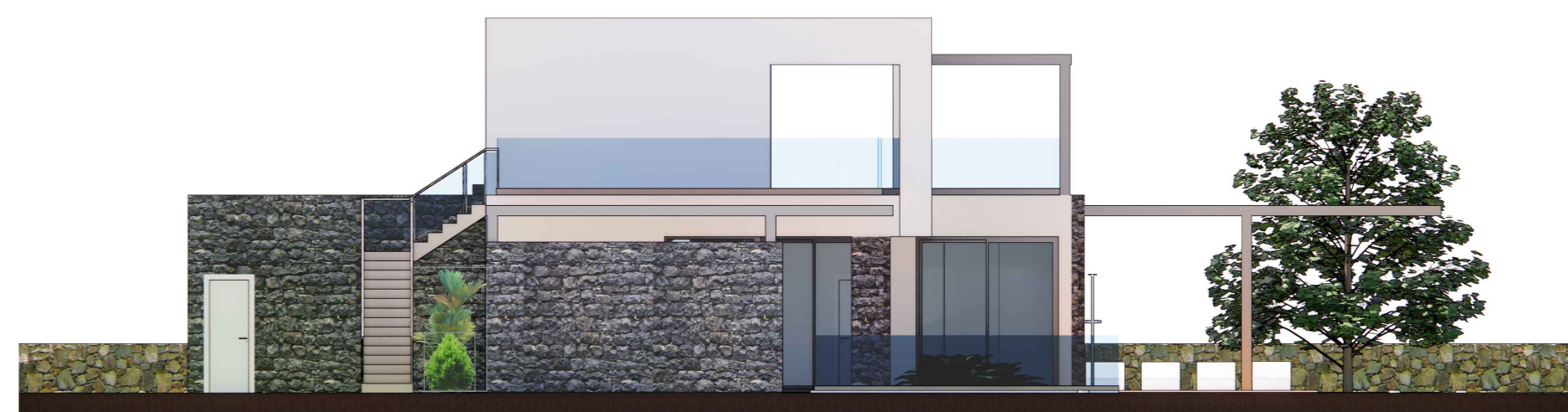
ALZADO LATERAL IZQUIERDO